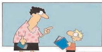
Si chiama leggere: è così che le persone installano nuovi software nel loro cervello

Ecco qualche vocabolo del linguaggio sms utilizzato ormai normalmente per mandare messaggi